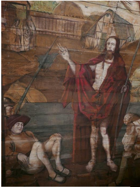
de Opstanding (Grote Kerk Naarden)

Nadat Simson in Gaza met een prostituee geslapen heeft leggen de Gazieten een hinderlaag om hem tegen de morgen te kunnen doden. Rond middernacht staat Simson echter op, grijpt de deuren van de stadspoort en rukt ze los. Hij legt ze op zijn schouders en brengt ze naar de top van de berg tegenover Hebron. Dat is plaats van Abraham, een stuk beloofd land, waar aartsmoeder Sara begraven werd; een plaats vol betekenis en belofte.